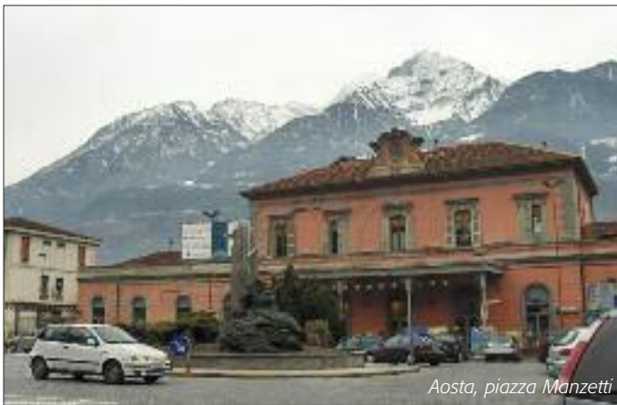
Aosta, piazza Manzetti