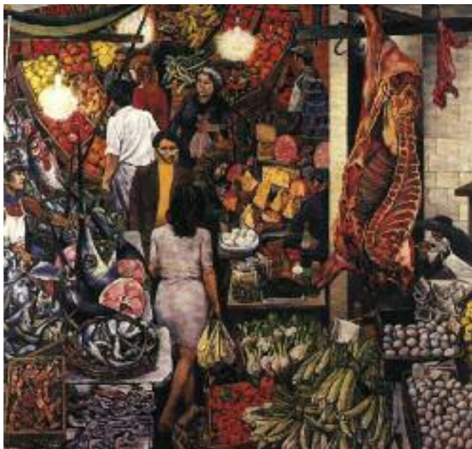
"Mercato della Vucciria" di Renato Guttuso.

Certo il Mercato Coperto non è proprio un biglietto da visita per i turisti (occasionalmente) che li si affacciano. Tre Assessori al Commercio fa nelle riunioni periodiche già era stato sollevato il problema, e proprio dall'Assessore dell'epoca. Ho tre miliardi di lire per rimodernare il mercato coperto, disse, apriamo una discussione. Voi associazioni potete garantire l'apertura giornaliera dei banchi, il quesito non è semplice, perché la licenza dei commercianti del M.C. è equiparata a quella su pubblica piazza e dato che alcuni commercianti hanno anche altre piazze da coprire un problema esisteva ed esiste, credo. Se va tenuto aperto il mercato di cui stiamo parlando tutti i giorni la licenza dovrebbe essere sdoppiata, licenza fissa lì e li-